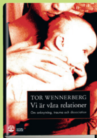
Tor Wennerberg Vi är våra relationer