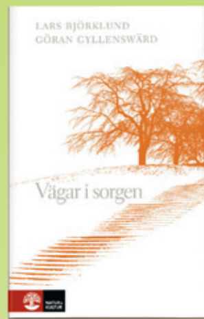
Lars Björklund/ Göran Gyllensvärd Vägar i sorgen