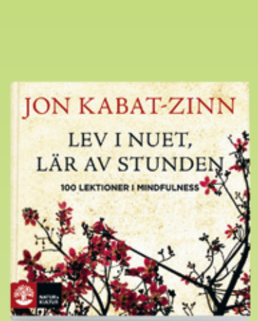
Jon Kabat-Zinn Lev i nuet, lär av stunden