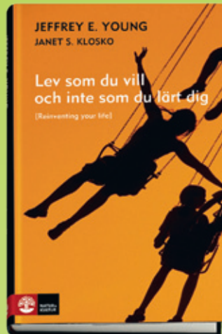
Jeffrey E. Young/Janet S. Klosko Lev som du vill och inte som du lärt dig